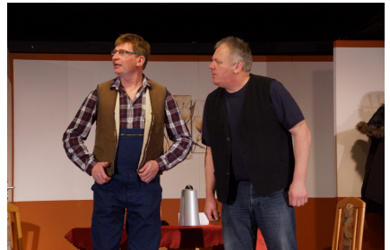
„Laat de Sau rut“ März 2018